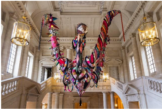
Mary Poppins, 2012

Ces œuvres, aux dimensions et à la symbolique puissantes, invitent à une promenade onirique où se mêlent tradition et modernité, féminité et pouvoir.