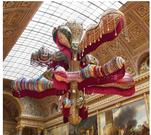
Royal Valkyrie, 2012

Royal Valkyrie représente une déesse guerrière exubérante, vêtue de brocarts floraux aux motifs et techniques inspirés de Nisa, un village portugais renommé pour son savoir-faire artisanal. Les sculptures molles qui composent cette installation, réalisées avec des crochets et des boudins de tissu, rappellent l'art baroque portugais avec une vision novatrice propre à l'artiste.